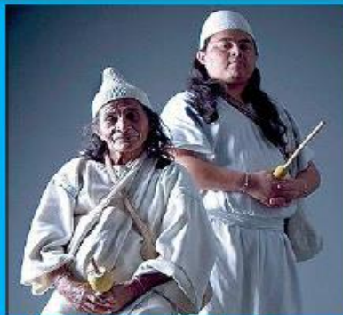
104 Pueblos Originarios y Comunidades Afro. 63 lenguas