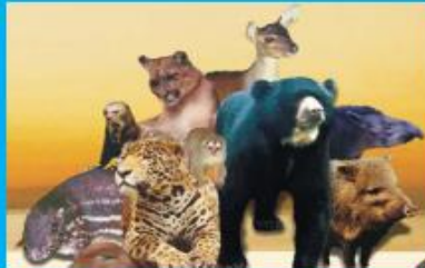
454 Especies de Mamíferos