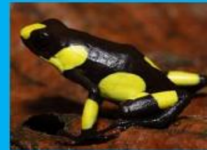
583 Especies de Anfibios