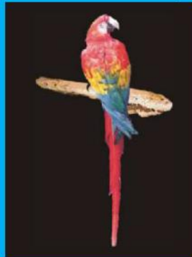
1815 Especies de Aves