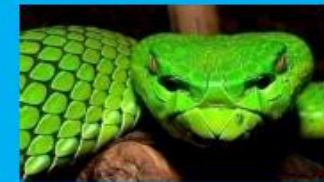
506 Especies de Reptiles