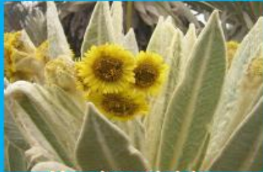
Megadiversidad de Especies Vasculares