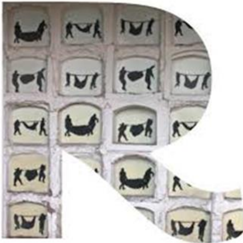
COLUMBARIOS, Beatriz González. 2009,

Secretaría de Educación Subsecretaría de Calidad